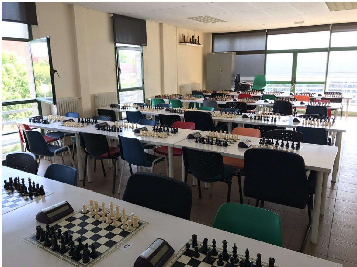
Panorámica Club Ajedrez Tres Cantos

El Club Ajedrez Tres Cantos -con 30 años de labor deportiva en nuestra ciudad- posibilita a las familias un ambiente adecuado y educativo para que los niños y niñas se diviertan con la práctica de nuestro deporte e interioricen, de forma amena, las ventajas que el ajedrez ofrece.